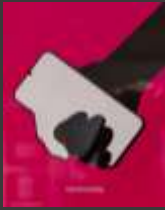
Legnica, exposition internationale Satyrykon 2024, « Relationship », de Szymon Lacheta (PL)