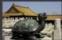
Pékin, cité interdite, tortue dragon symbolisant le courage, la détermination, la fertilité, la longévité, la puissance, le succès