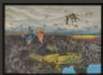
Katowice, musée de la Silésie, « Ukraine, peur », 2022, Jerzy Kasperek