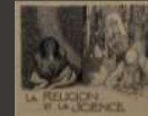
Exposition Kupka, illustration pour l'Homme et la Terre d'Elisée Reclus, 1905-1908