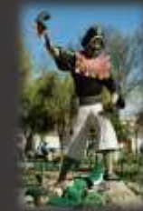
Bolivie, Tarabuco, guerrier yampara arrachant le cœur d'un soldat espagnol et le dévorant.